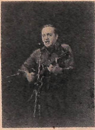
2. Автор и исполнитель песен Сергей Никитин.