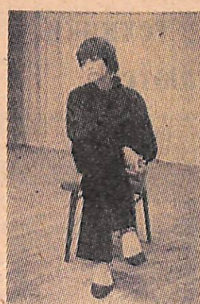
4. Поэт Белла Ахмадулина.