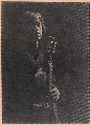
3. Поэт Владимир Высоцкий.