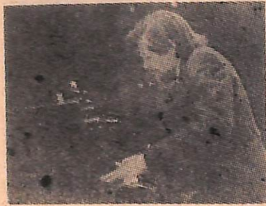
5. Автор и исполнитель литературных композиций, артист Москонцерта Максим Кончаловский.