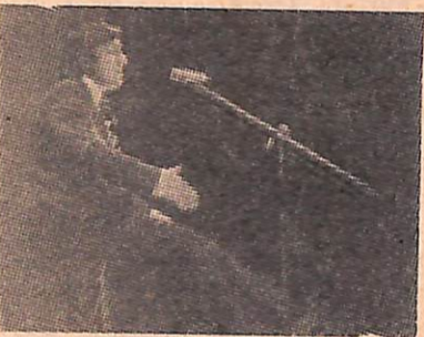
7. Пародист Геннадий Хазанов.